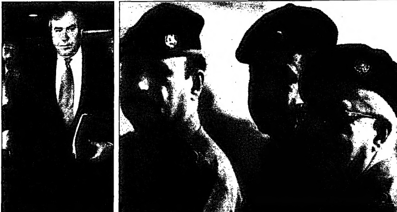
نائب رئيس الوزراء العراقي طارق عزيز مع حسن المجيد ومحمد علي الزبيدي في بغداد أمس